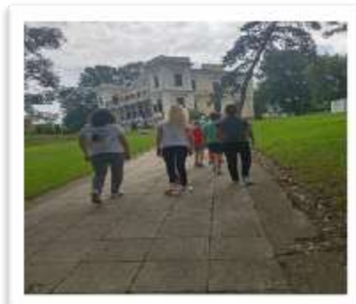
Дворац Белимарковића- музеј