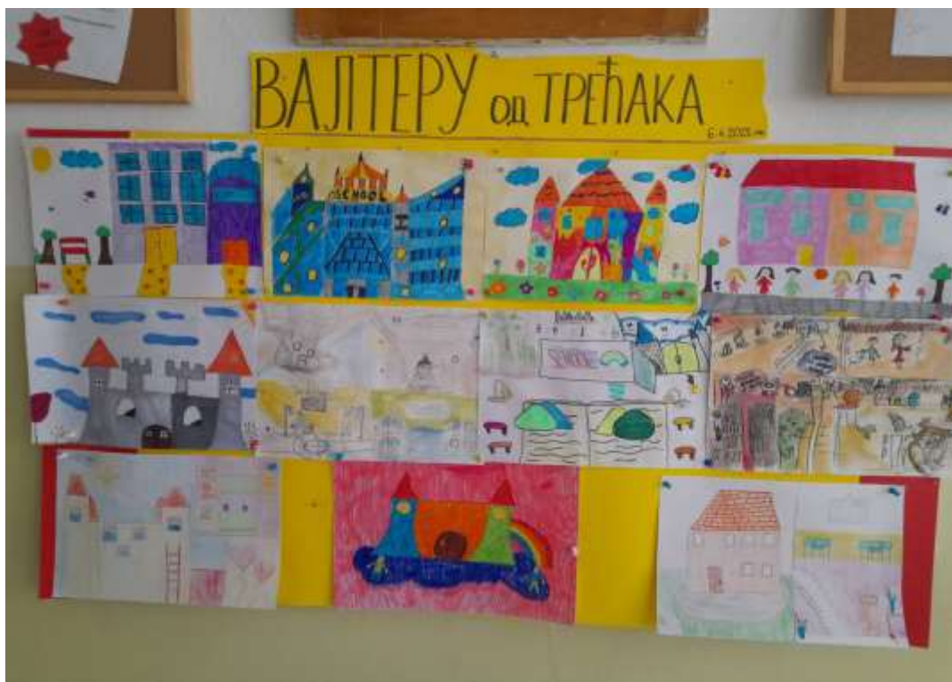
„Валтеру од трећака“ - пано ученичких радова

Председник Одељењског већа трећег разреда,