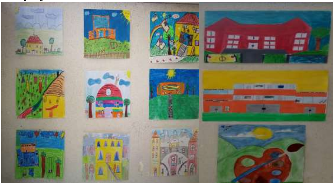
Део изложбе ликовних радова